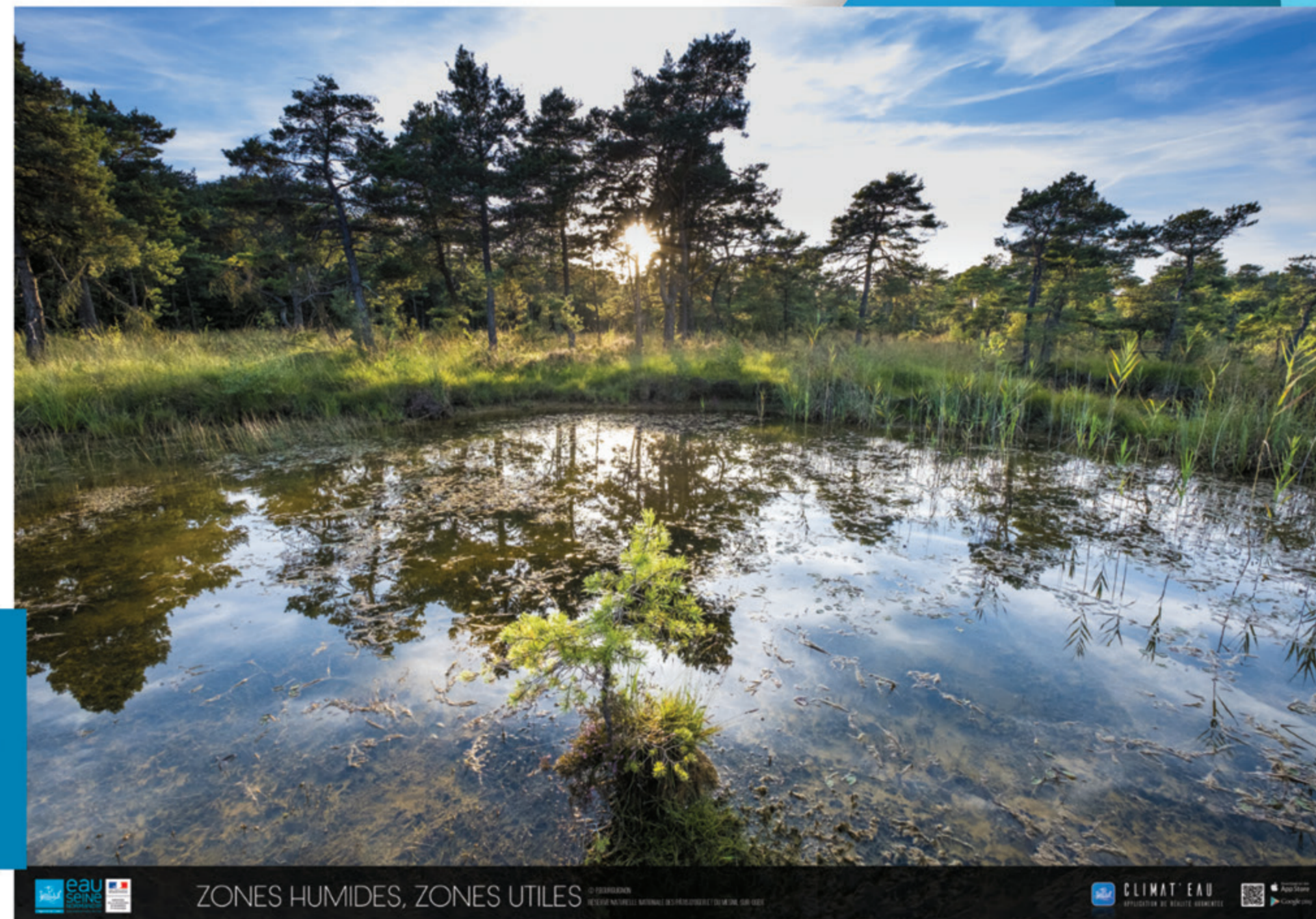
ZONES HUMIDES, ZONES UTILES