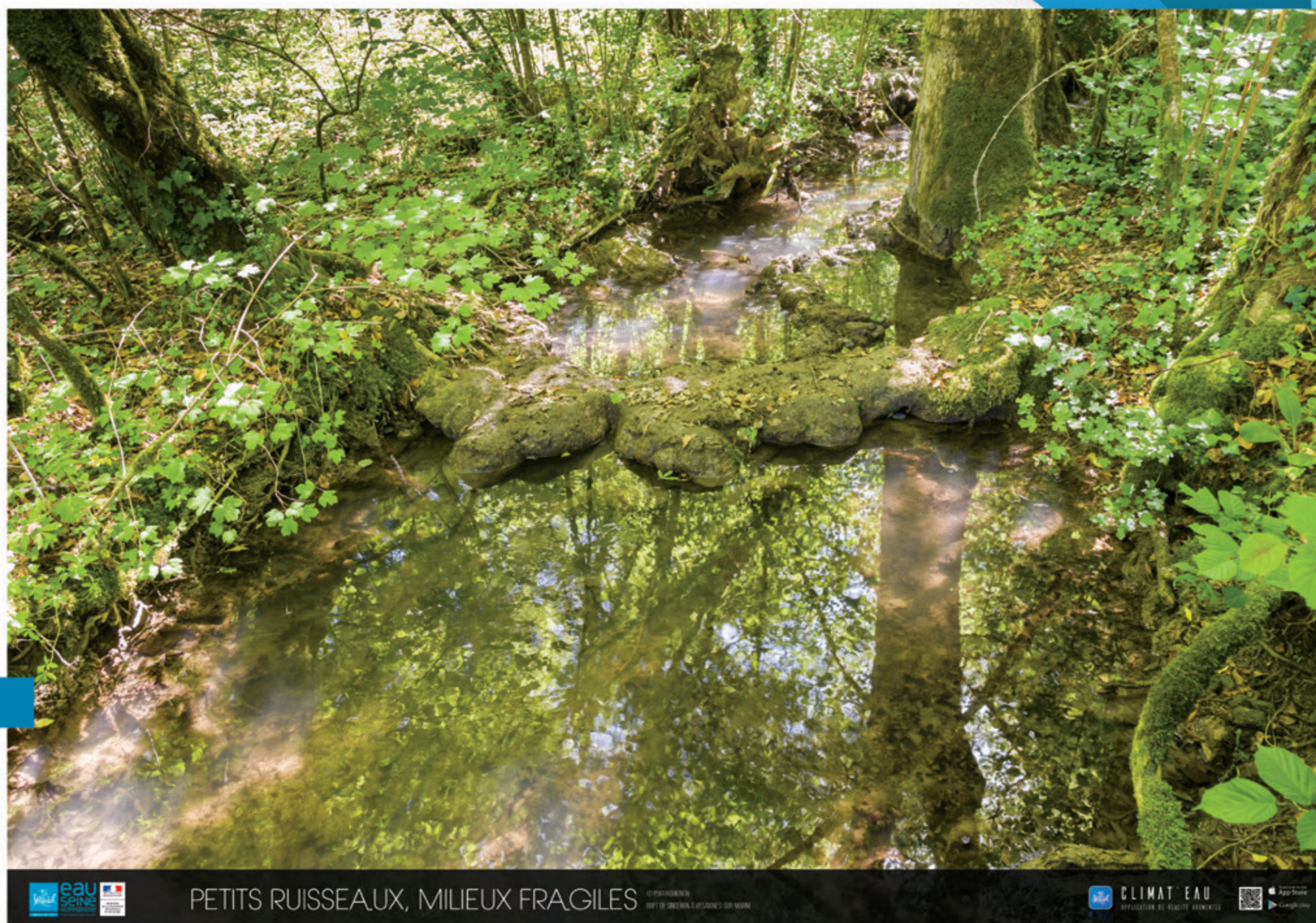
PETITS RUISSEAUX, MILIEUX FRAGILES