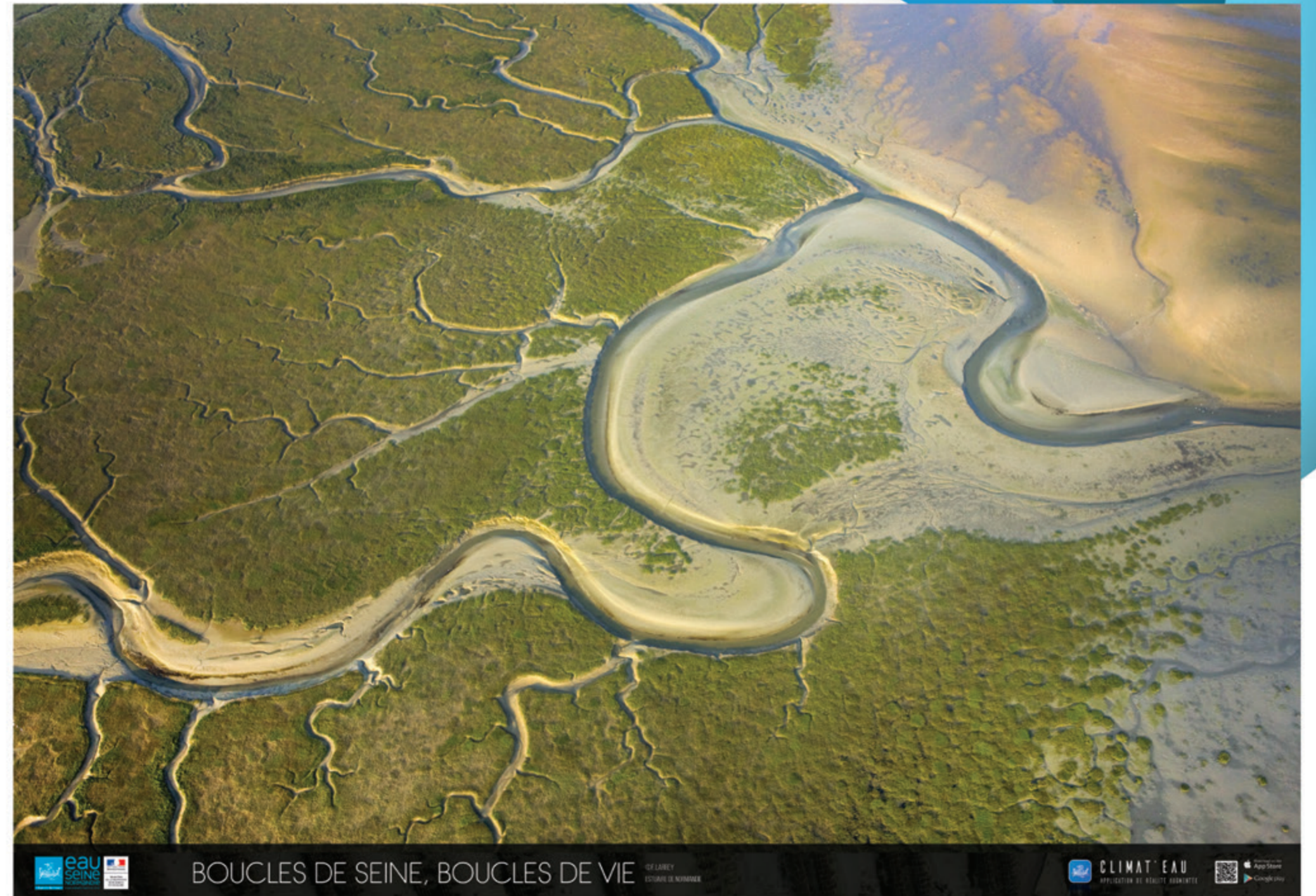
BOUCLES DE SEINE, BOUCLES DE VIE

LE PROGRAMME BOUCLES DE SEINE, BOUCLES DE VIE