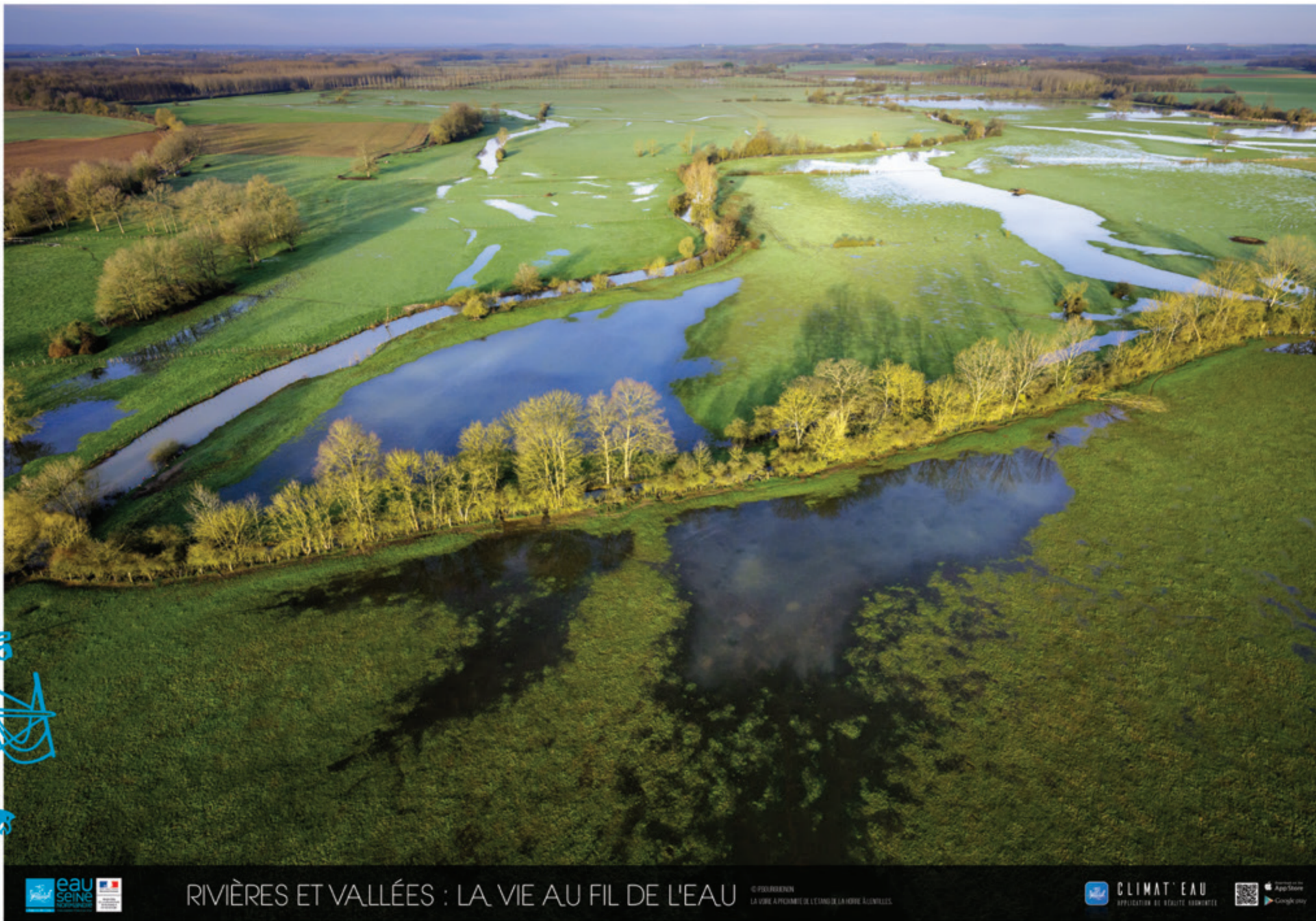
RIVIÈRES ET VALLÉES : LA VIE AU FIL DE L'EAU

LE PROGRAMME LA VIE AU FIL DE L'EAU LA VIE AU FIL DE L'EAU