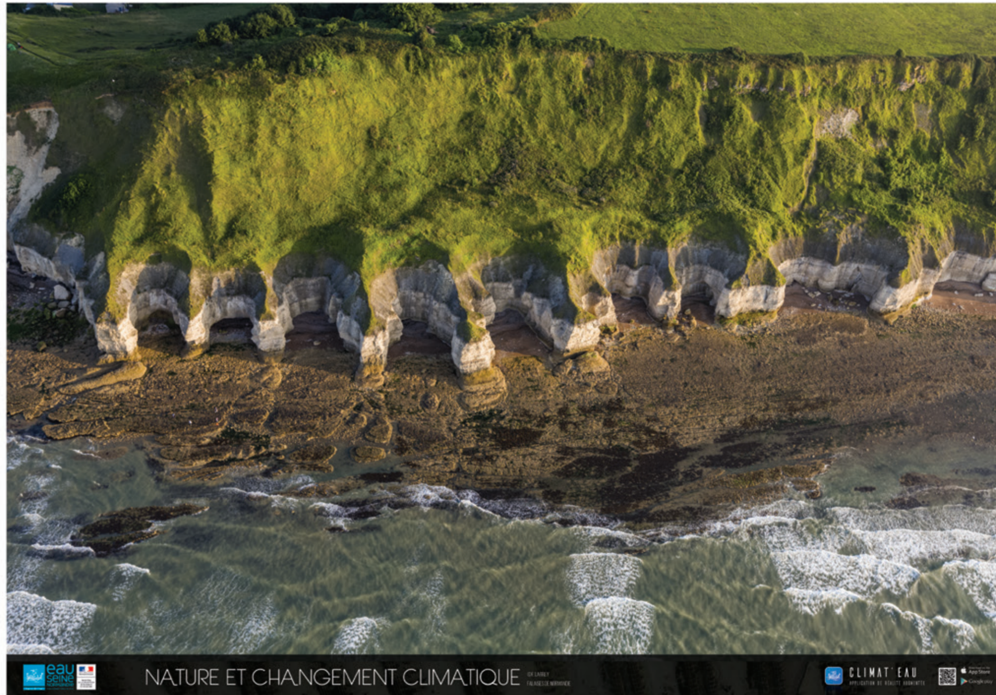
NATURE ET CHANGEMENT CLIMATIQUE

LE PROGRAMME NATURE ET CHANGEMENT CLIMATIQUE